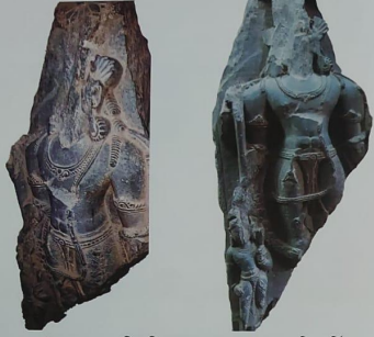
গোবান্দুপুৰ খানায়ৱাক্তিত বিষ্ণুপুৰ অঞ্চল ৰেকে পাওয়া ভগ্ন বিষ্ণু মূৰ্তি