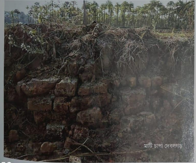
মাটি চাপা দেবনগড়