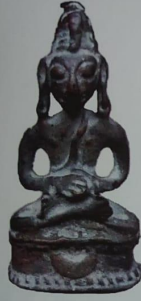
পাটনৰ মুচলিমপুৰ বুদ্ধ