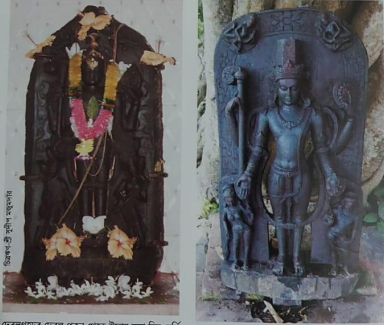
দেবনগড়ৰ দেবন পুৰ ৰেকে উদ্ধাৰ কৰা বিষ্ণু মূৰ্তি